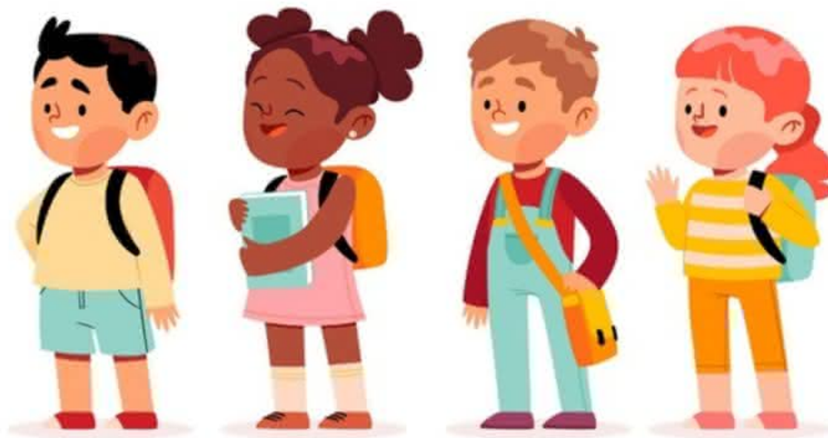
Gincana da @JornadaX: Ação emergencial reúne comunidade, alunos e professores em formato de game para a volta às aulas presenciais